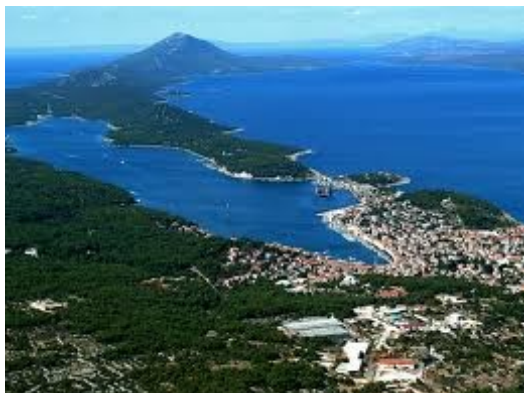
Inselgruppe Mali Losinj mit der Hauptinsel Cres

Auf der Insel gibt es Kies- und Sandstrände. Ein Sandstrand liegt direkt bei uns am Platz.